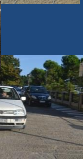
Abbiamo cercato di postare una foto di ogni equipaggio, ma eravate tanti....